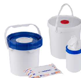
Different packaging available on demand