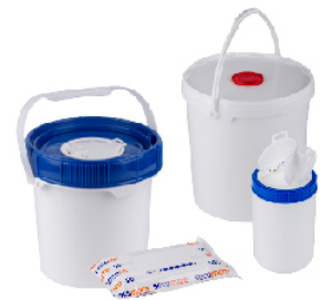
Different packaging available on demand